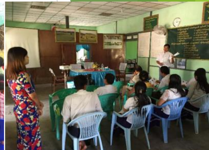
Discussion about the sweet potato production with the DoA staff