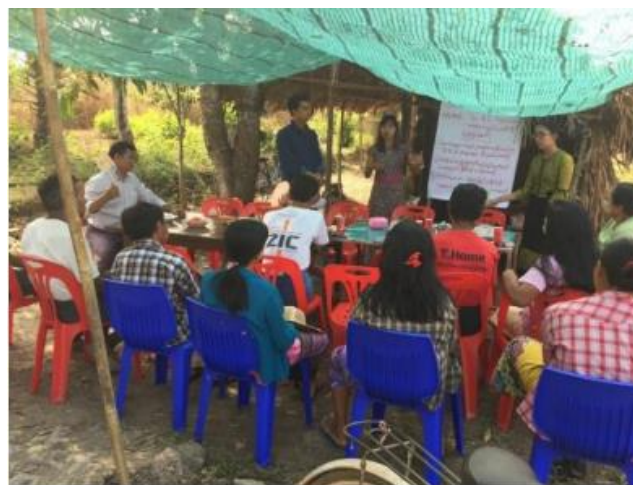
Community mobilization meeting at the village