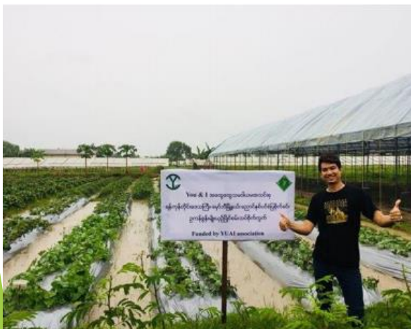
Well Developed Research Farm of Hatoyama Demo Farm Project at Myanmar