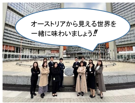
2022年度 第二陣/国連機構の中庭にて