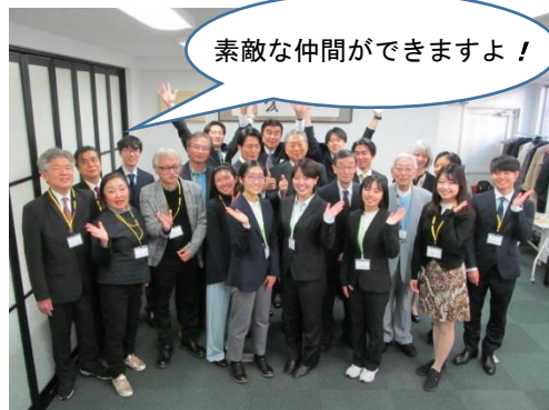
友愛勉強会・懇親会でのひとこま